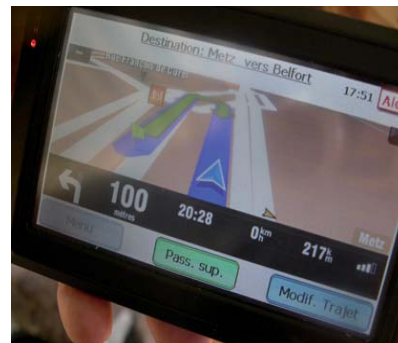
Ecran de navigation pour un conducteur.

Responsabilités, Disponibilité du service, Inscriptions, Mineurs, Comportement des utilisateurs sur le site internet et au travers des modes de communication mis à disposition, Déclaration d'un trajet, Horaires, Organisation des équipages de covoiturage, Animaux et bagages, Rôle de chacun, Engagement des passagers, Engagement des conducteurs, Assurance, Itinéraires, Participation aux frais, Période d'essai et préavis de désengagement, Conservation des données et Informatique et liberté.