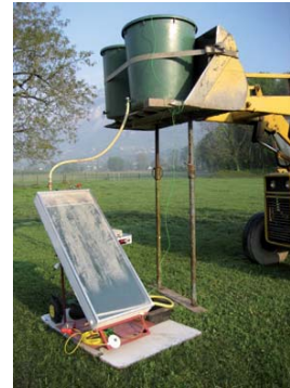
Prototype 2 en fonctionnement sur banc d'essai