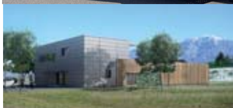
Ouverture en septembre 2010 de la Cuisine Centrale (SCI L'ATELIER ROCHOIS), investissement 1 500 K€.