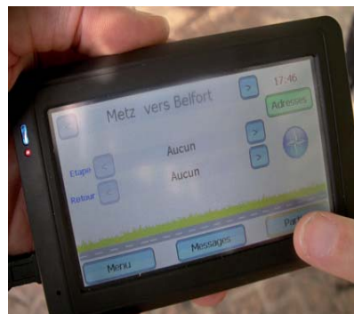
Validation d'un trajet d'un passager sur le boîtier.